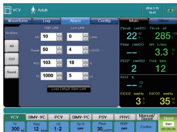
Интерфейс настройки сигнализации