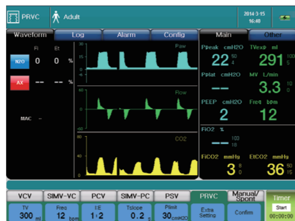
Расширенный режим вентиляции