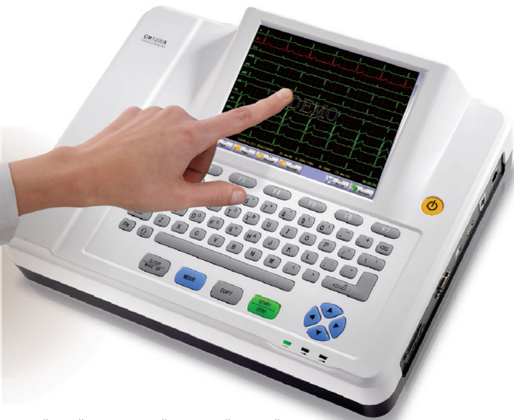
8,4-дюймовый светодиодный сенсорный дисплей