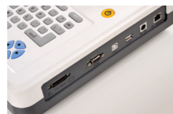
Память на 300 записей ЭКГ; USB для передачи данных; Поддержка программного обеспечения ПК-ЭКГ; Поддержка подключения внешнего принтера.