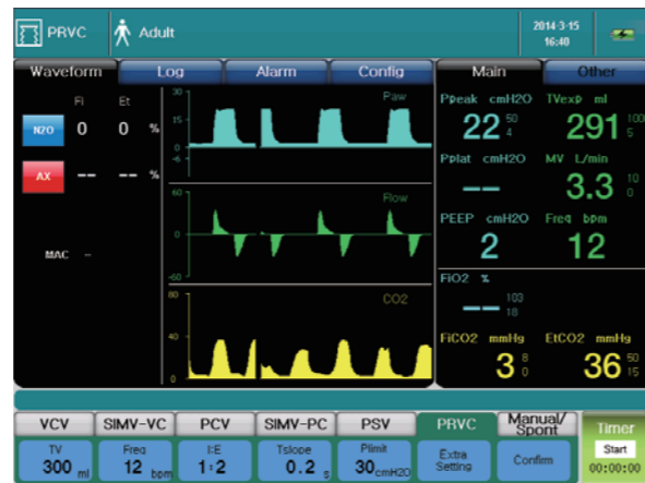
Расширенный режим вентиляции