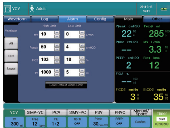
Интерфейс настройки сигнализации