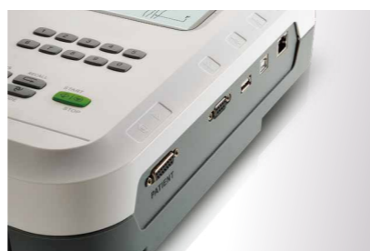
Память на 300 ЭКГ-записей; USB для передачи данных; система управления ПК-ЭКГ